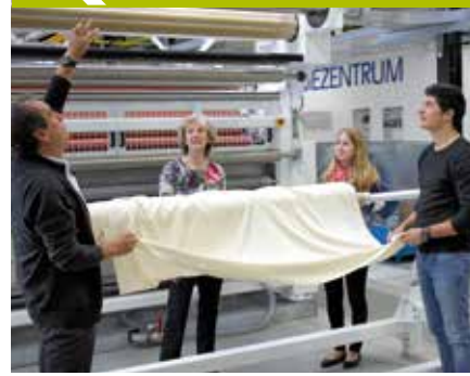
BRÜCKNER Trockentechnik GmbH & Co. KG

Darauf aufbauend wurde unter dem Titel vit@work ein Work-Life-Management-Konzept mit den fünf zentralen Bausteinen Gesundheit, Familie, Flexibilisierung von Ort und Zeit, generationenübergreifendes Denken und flankierende Maßnahmen entwickelt. Ein Lenkungsteam schuf den Rahmen, in dem sich Geschäftsführung und Mitarbeiter regelmäßig zum Programm austauschen konnten und konkrete Maßnahmen entwickelt wurden. Das vit@work-Konzept reicht von hochflexiblen Arbeitszeitmodellen, Familienpflegezeit, Home-Office-Strukturen und Sabbaticals über die Umgestaltung von Großraumbüros, der Kantine und Schaffung einer Grünfläche für Pausen im Freien bis hin zu gesundheitsfördernden Maßnahmen. Es gibt freies Obst und Wasser für alle und Zuschüsse zu Massagen und Krankengymnastik. Professionalisiert wurde zudem der Austausch zwischen den verschiedenen Mitarbeitergenerationen.