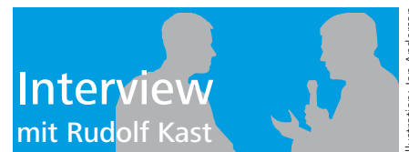
Illustration: Jan Anderson

Rudolf Kast: Bei Sick verstehen wir das Thema Demographie nicht bezogen auf eine bestimmte Altersgruppe, sondern haben das gesamte Arbeitsleben der Beschäftigten im Blick. Entsprechend verfolgen wir auch bei der Gesundheitsförderung einen ganzheitlichen Ansatz, bei dem die verschiedenen Lebensabschnitte der Arbeitnehmer und die sich daraus ergebende unterschiedliche Belastbarkeit ausdrücklich berücksichtigt werden.